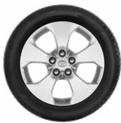
17"-os téli szerelt kerék alufelnivel és Bridgestone LM 005 gumiabronccsal*