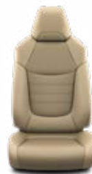
Bézs színű Alapfelszereltség az Executive felszereltségnél