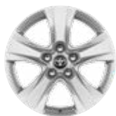
17" világos ezüst színű könnyűfém keréktárcsák (5 küllős), 225/65 R17 gumiabronccsal Alapfelszereltség a Hybrid Active és a Comfort felszereltségnél