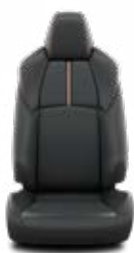
Fekete bőr narancssárga varrással Alapfelszereltség az Adventure felszereltségnél