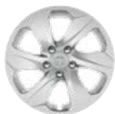
17" acél keréktárcsák ezüst színű disztárcsával (6 küllős), 225/65 R17 gumiabronccsal Alapfelszereltség az Active felszereltségnél