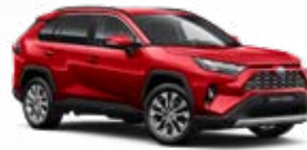
3U5 Érzéki vörös** 310 000 Ft