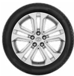
18"-os téli szerelt kerék alufelnivel és Bridgestone LM 005 gumiabronccsal*