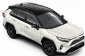
2PS Platina gyöngyfehér fekete tetővel** Selection felár nélkül