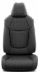
Fekete szövet Alapfelszereltség a Comfort felszereltségnél