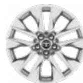
19" ezüst színű könnyűfém keréktárcsák (10 küllős), 225/55 R19 gumiabronccsal Alapfelszereltség az Executive felszereltségnél