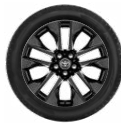
19"-os téli szerelt kerék alufelnivel és Bridgestone LM005 gumiabronccsal**