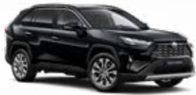
218 Fekete gyöngyház* 190 000 Ft