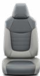
Világosszürke bőr Alapfelszereltség az Executive felszereltségnél