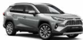
1D6 Ezüstmetál* 190 000 Ft