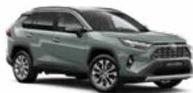
6X3 Olivazöld 175 000 Ft