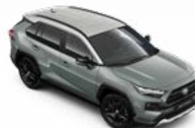
2QU Olivazöld nikkeltetál tetővel Adventure felár nélkül