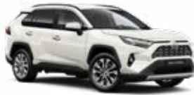
089 Platina gyöngyfehér** 310 000 Ft