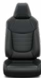
Fekete bőr Alapfelszereltség az Executive felszereltségnél