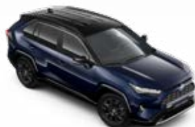
2RA Éjkék fekete tetővel* Selection felár nélkül