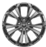
18" sötét ezüst színű könnyűfém keréktárcsák (5 küllős), 225/60 R18 gumiabronccsal Alapfelszereltség a Comfort Style felszereltségnél