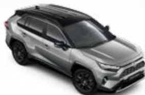
2QY Ezüstmetál fekete tetővel* Selection felár nélkül