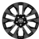
19" lakkfekete könnyűfém keréktárcsák (5 duplaküllös küllős), 235/55 R19 gumiabronccsal Alapfelszereltség a Selection felszereltségnél