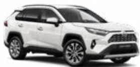
040 Hófehér felár nélkül