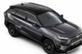
2QZ Hamuszürke fekete tetővel* Selection felár nélkül