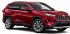
3T3 Burgundivörös** 310 000 Ft