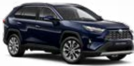
8X8 Éjkék* 190 000 Ft