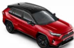
2SC Érzéki vörös fekete tetővel** Selection felár nélkül