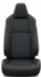
Fekete bőrhatású szövet kék varrással Alapfelszereltség a Selection felszereltségnél