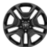
19" matt szürke színű könnyűfém keréktárcsák (5 küllős), 235/55 R19 gumiabronccsal Alapfelszereltség az Adventure felszereltségnél