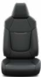
Fekete szövet Alapfelszereltség az Active felszereltségnél