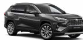
1G3 Hamuszürke* 190 000 Ft